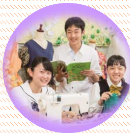
普通科 (ファッションコース)