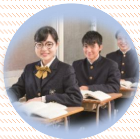
普通科 (医療系進学コース)

中学3年生の皆さん、進路決定を目前にひかえ、ますます勉強に励んでおられることと思います。 杉森高等学校では、「受験生と保護者のための学校説明会」を開催します。この学校説明会では、2019年度入学試験に関する情報をたくさん得ることができます。また、過去の本校入試問題集もプレゼント!! ご都合のよい日にぜひご参加下さい。