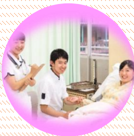
看護科・看護専攻科 (5年一貫)